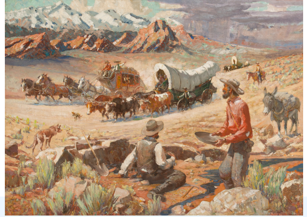
BEFORE 1942, OIL ON CANVAS, 26.25 X 36.25 INCHES