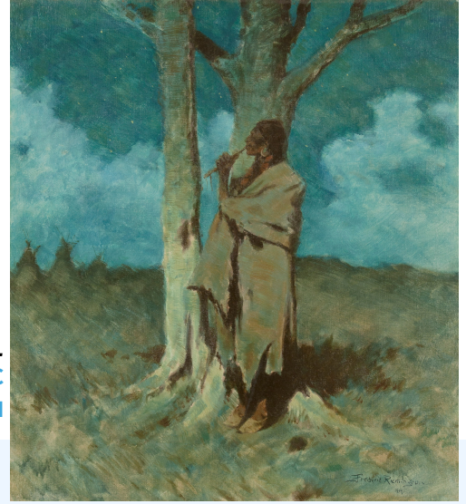
1909, OIL ON CANVAS, 31 X 28 INCHES