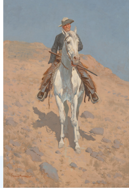
CA. 1890, OIL ON CANVAS, 29.1875 X 19.375 INCHES

SELF-PORTRAIT ON A HORSE FREDERIC REMINGTON