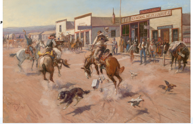
1907, OIL ON CANVAS, 24.125 X 36.125 INCHES

UTICA (A QUIET DAY IN UTICA) CHARLES RUSSELL