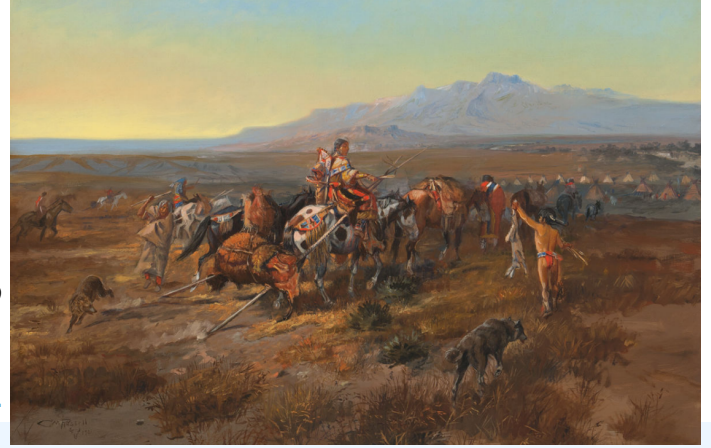
1901, OIL ON CANVAS, 24.125 X 36 INCHES